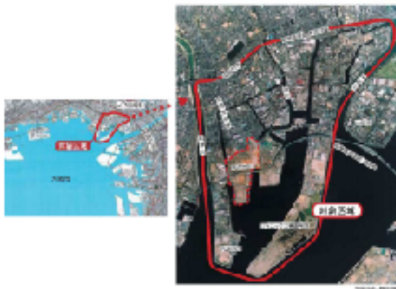
◎尼崎臨海地域まち再生プロジェクト（第2次）の範囲とされています。 ※兵庫県・尼崎市のパンフレットより

尼崎21世紀の森づくりは、尼崎臨海地域（約1,000ha）を舞台に、水と緑豊かな自然環境を創出し、自然と人が共生する環境共生型のまちづくりをめざす、100年の時を翔ける壮大なプロジェクトです。